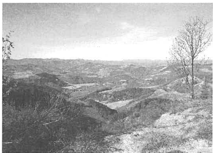
Gli Appennini Tosco-Emiliani in cui inizia il Cammino di Assisi

Cammino di Santiago di Compostela e viene così riassunto: quasi 300 km di sentieri a partire da Montepaolo e attraverso gli appennini seguendo gli itinerari francescani fino ad Assisi.