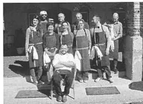
Gli allievi del corso di cucina